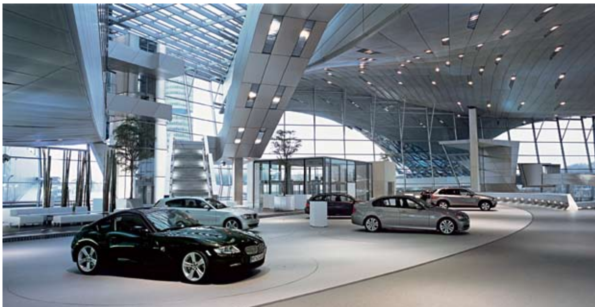
Présentation personnalisée de l'automobile sur la scène du hall « Première ».

Avant de prendre livraison de votre voiture, nous vous invitons cordialement à assister à une présentation complète sur mesure de votre nouvelle BMW. Il s'agit d'une démonstration exceptionnelle, dont vous pouvez uniquement prendre connaissance au BMW Welt. Au moyen de films et d'applications multimédias, votre préposé vous montre toutes les fonctions importantes et tout l'équipement de votre voiture.