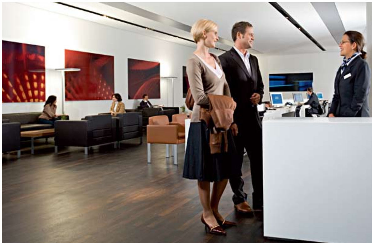
Réception personnalisée au comptoir d'accueil du salon Premium, niveau 3.

Ensuite, nous vous aiderons à planifier votre journée au BMW Welt. Voyez à quoi ressemble une journée idéale dans les pages suivantes.